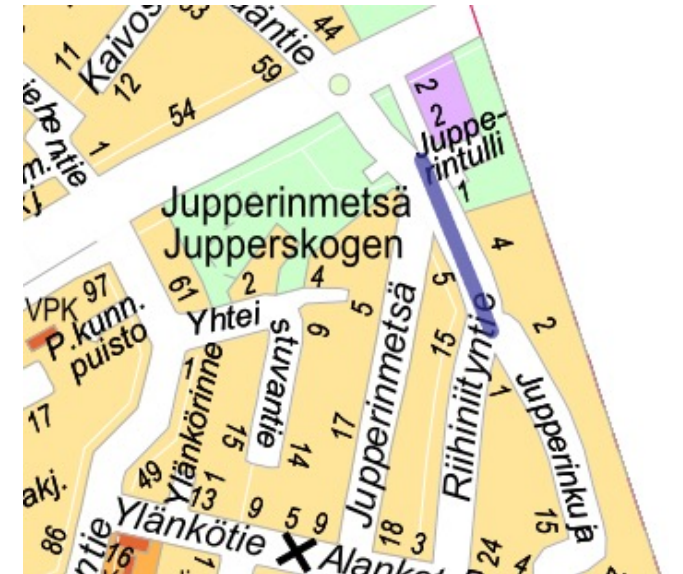
Jupperinmetsä, Espoon karttapalvelut

12.3.2024 Jupperin Omakotiyhdistys ry:n hallitus