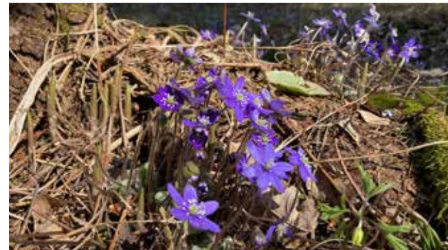
Huhtikuun ensimmäiset sinivuokot.