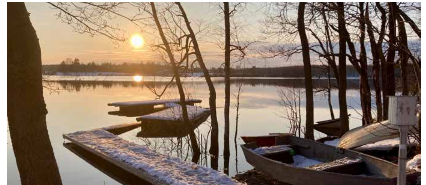
Jo ennestään huonossa kunnossa ollut Surffirannan laituri kärsi pahoin jäiden lähdöstä.