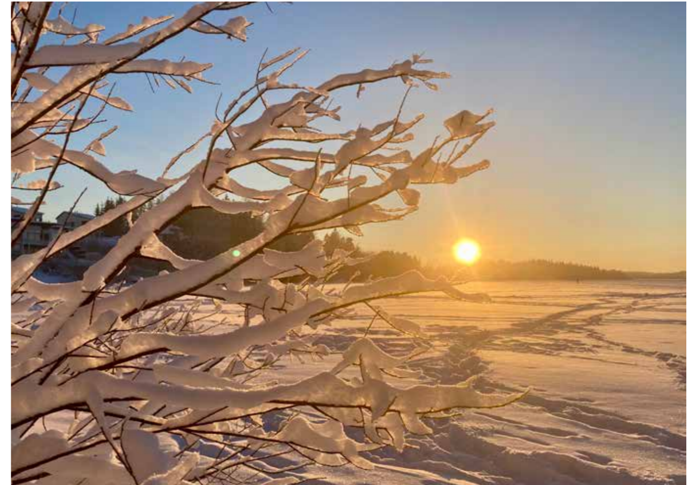
Runsaasti lunta ja pakkasta saatu tähän talveen.