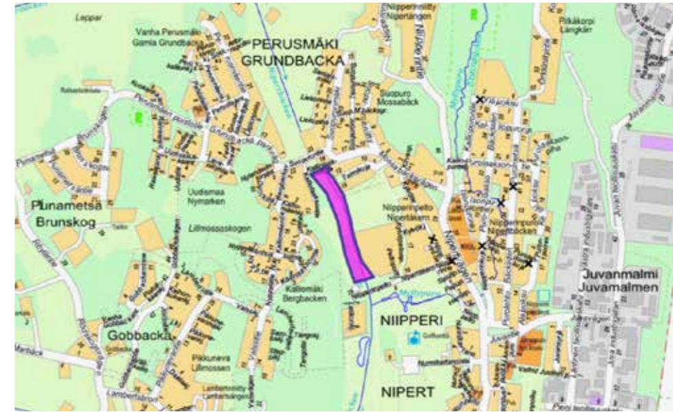
Kuva 2. Niipperinojan tulvatasanne. kartat.espo.fi