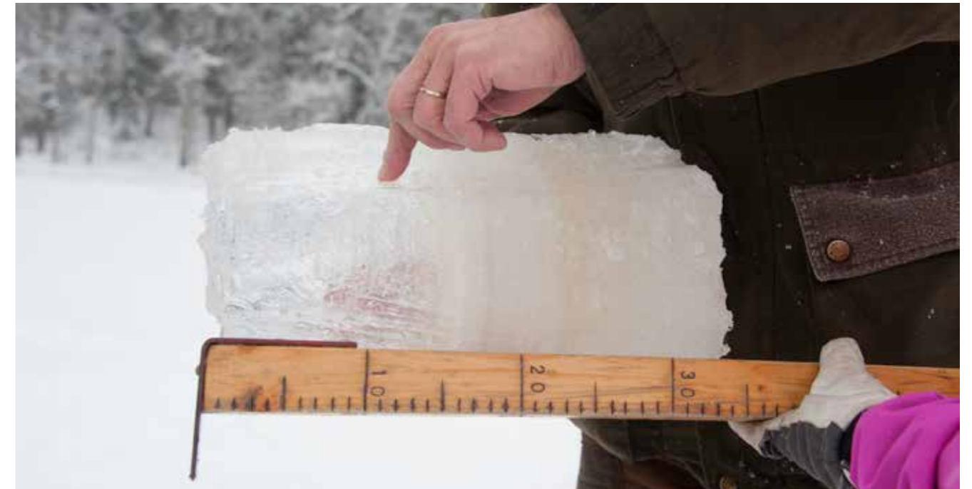
Tammikuun 21. päivänä Pitkäjärven jäänpaksuus oli 36 cm, josta teräsjäätä 16 cm.

Pitkäjärvi kuuluu Suomen ympäristökeskuksen ylläpitämään valtakunnalliseen jäänpaksuuden havaintoverkostoon. Pitkäjärven jäänpaksuutta on seurattu vuodesta 1996 lähtien. Havaittajat käyvät järvellä jääpeitteisenä aikana 10 päivän välein. Mittaukset tehdään kolmesta avannosta Laaksoalahden urheilupuiston puoleisessa päässä järveä, 100 m etäisyydellä rannasta ja riittävän etäällä jäätymiseen vaikuttavista hapeuslaitteista ja avantouintipaikasta. Kolmen mittauksen keskiarvo tallennetaan reaaliajassa nettiin.