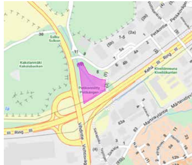
Kuva 1. Varistonojan vesienhallintarakenteet. © Vantaan kaupunki

Vantaalla muokataan Varistonojaa ja vähennetään ojan tulvimista Vihdintielle ja viereiselle Petikon yritysalueelle. Samalla vähenee ojaan päätyvien ravinteiden ja epäpuhtauksien määrä ja kulkeutuminen Pitkäjärveen (kuva 1).