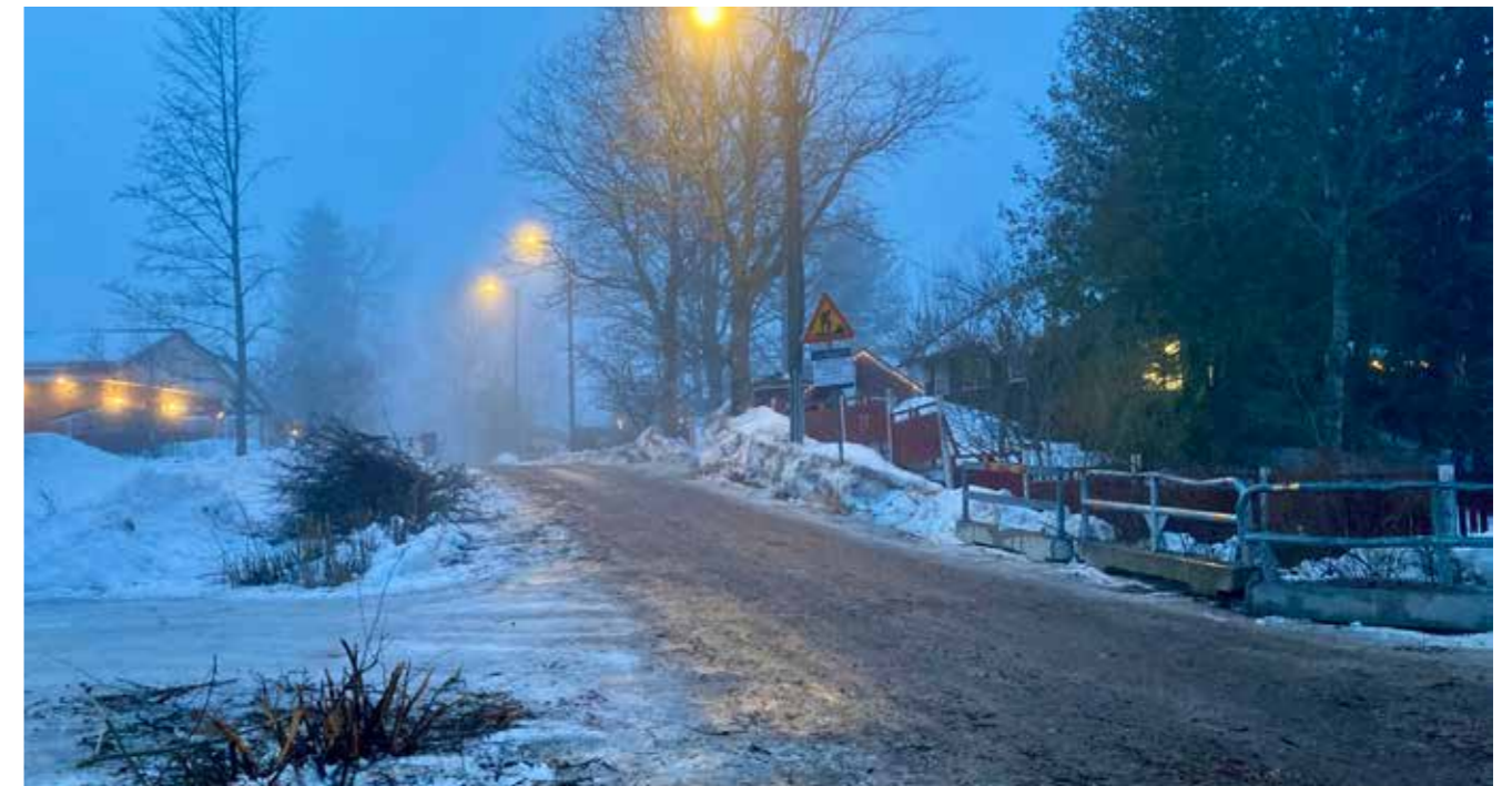
Tammikuun lopussa teiden kunnostustyöt jatkuivat Rantatiellä puuston kaadolla.

esponseurakunnat.fi facebook.com/lauluntarina