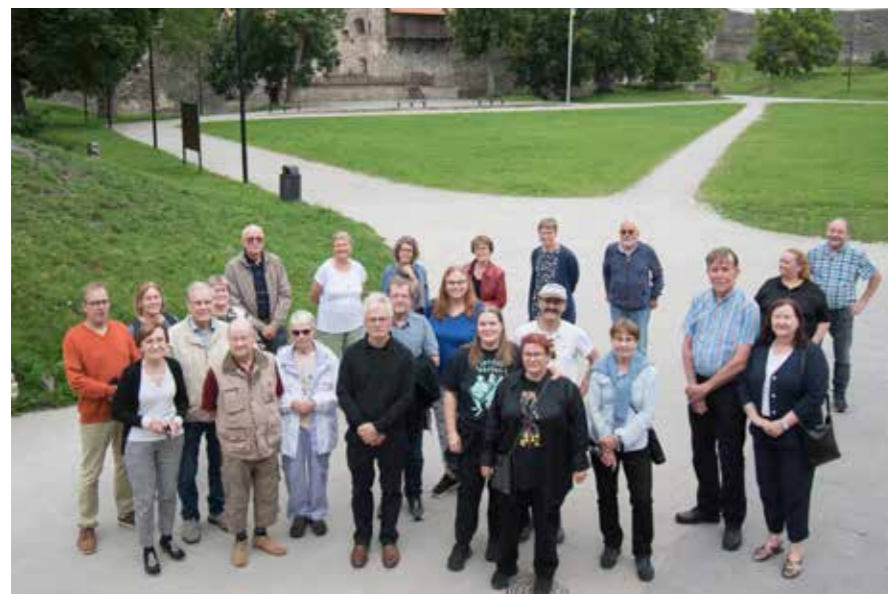
Matkalaiset Haapsalun piispanlinnan pihalla. Valokuvaaja Pekka järjestää matkalaisia kuvattavaksi.