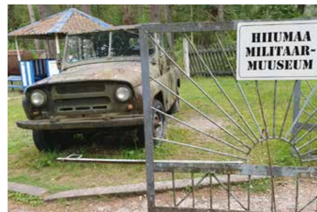
Hiidenmaan sotamuseo Tahkunan niemellä.