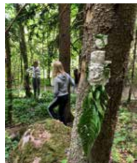
Kannen kuva: Taideleiriläiset metsässä, Leena Virtanen

Seuraava lehti 4/2023 ilmestyy 11.11.2023. Aineistot 19.10. mennessä toimitukseen.