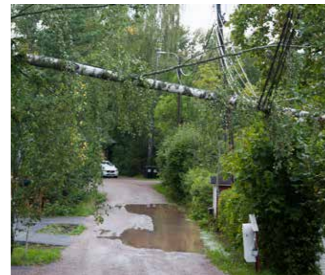
Peltotielä elokuisen myrskyn jälkeen.