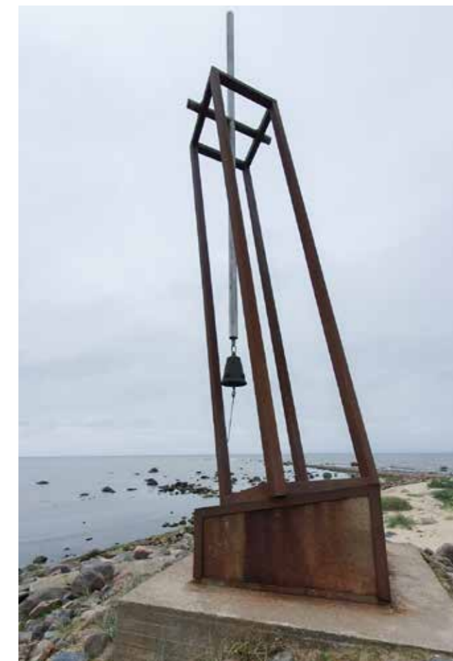
Estonian muistomerkki saaren pohjoiskärjessä.