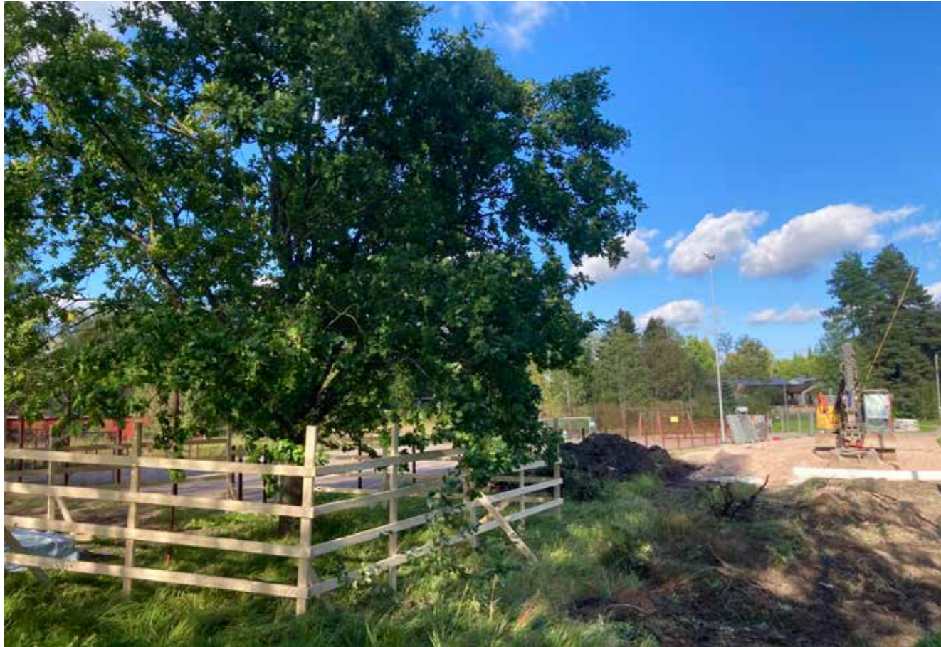
Näkymä Jupperin rantapuiston reunalta, kun tietyöt ovat alkamassa.