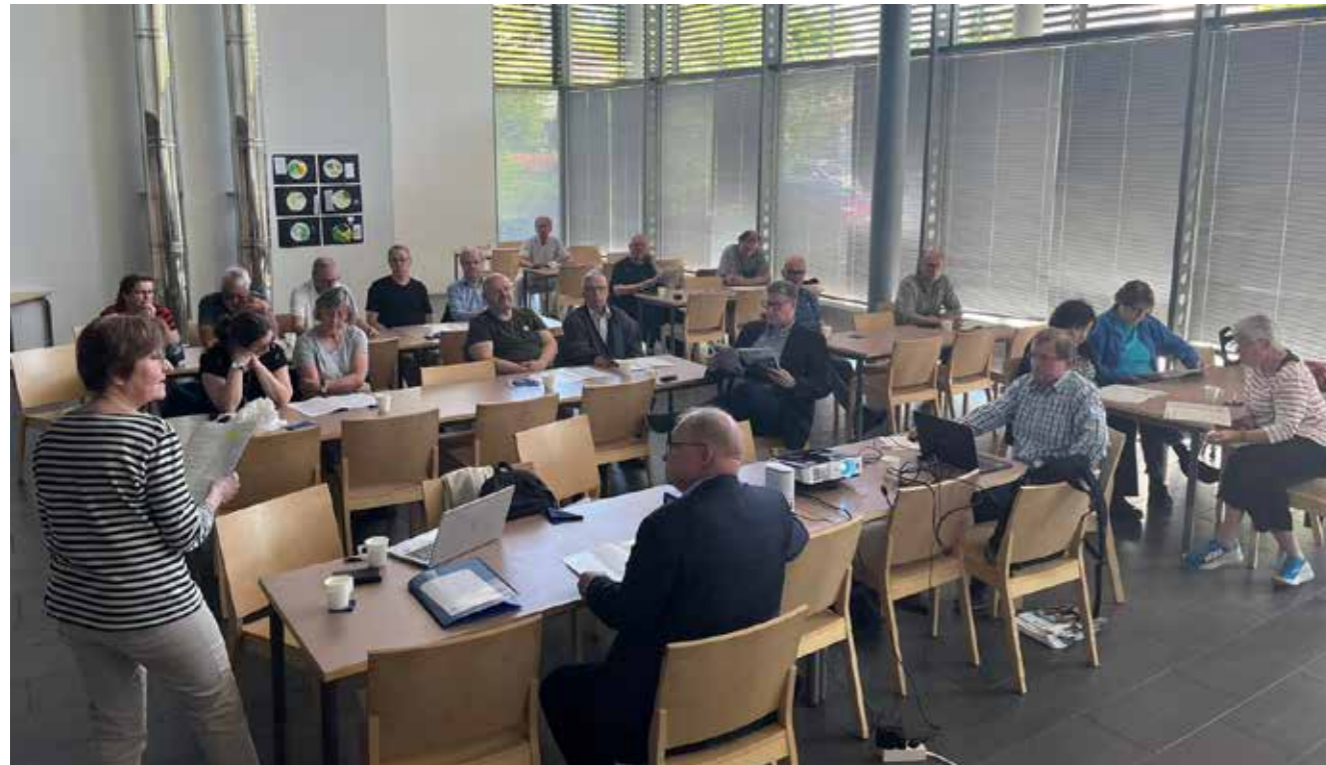
Kevätkokouksessa Laaksolahtitalolla.