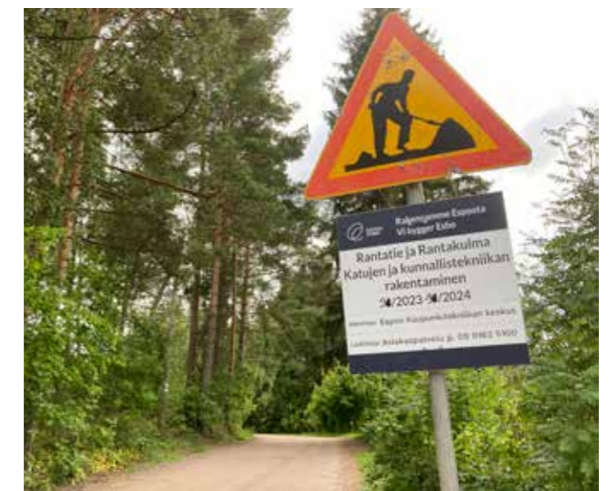
Kyltit ilmestyivät katukuvaan 31.8.