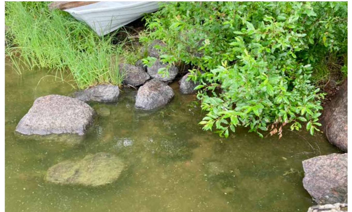
Sinilevät saapuivat Pitkäjärveen taas heinäkuussa uimareiden pettymykseksi.