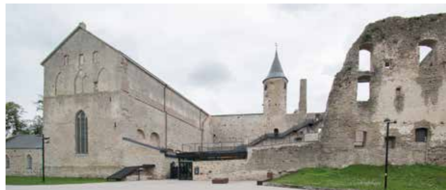
1200-luvulla rakennettu Haapsalun piispanlinna on yksi Viron parhaiten säilyneistä linnoituksista.