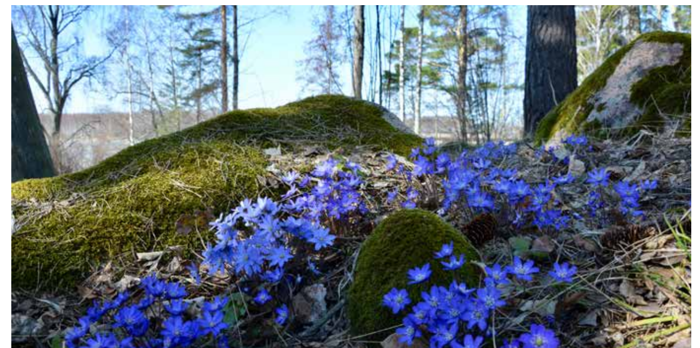
Sinivuokot ilmestyvät Jupperiin huhtikuun puolessa välissä.