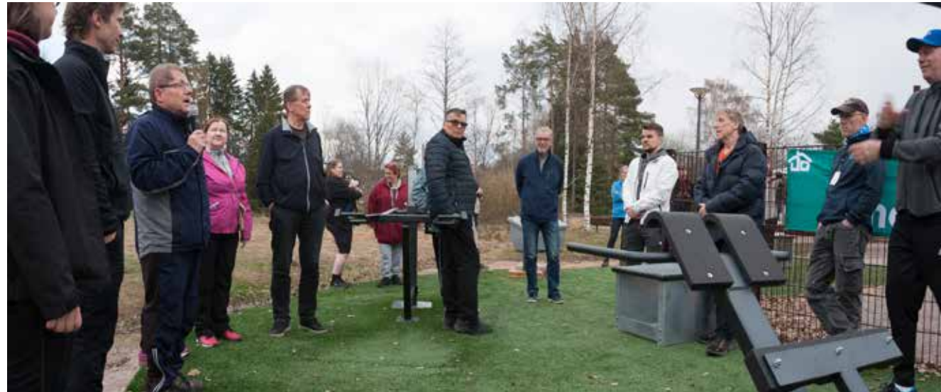
Ulkokuntosalin avajaisia pidettiin 25.4. Paikalla oli n. 50 henkeä sekä laitetoimittajan ja Espoon liikuntatoimen edustajat.