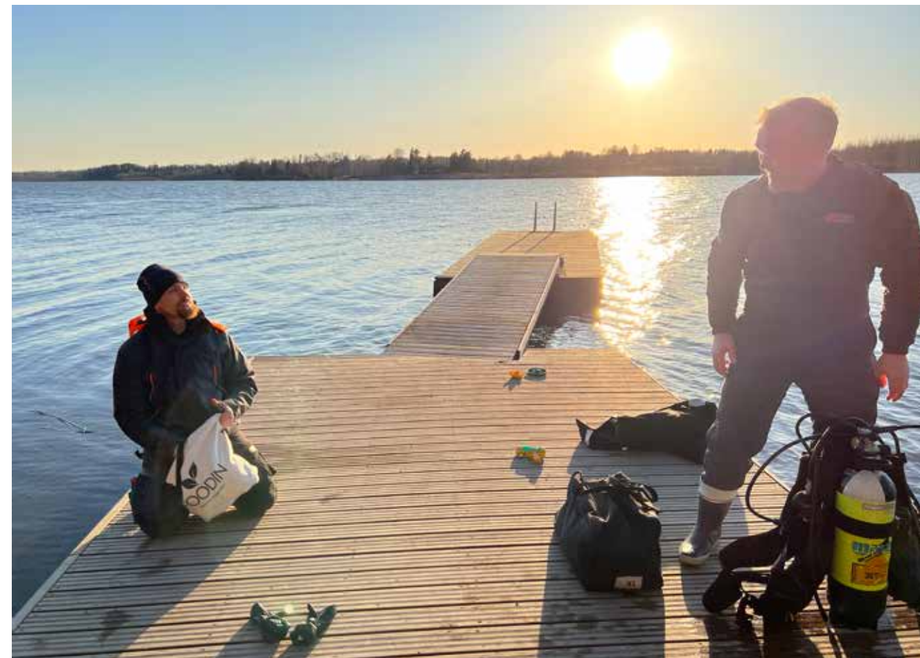
Jupperin rannan laituri saatiin tänä vuonna paikoilleen jo 18.4.