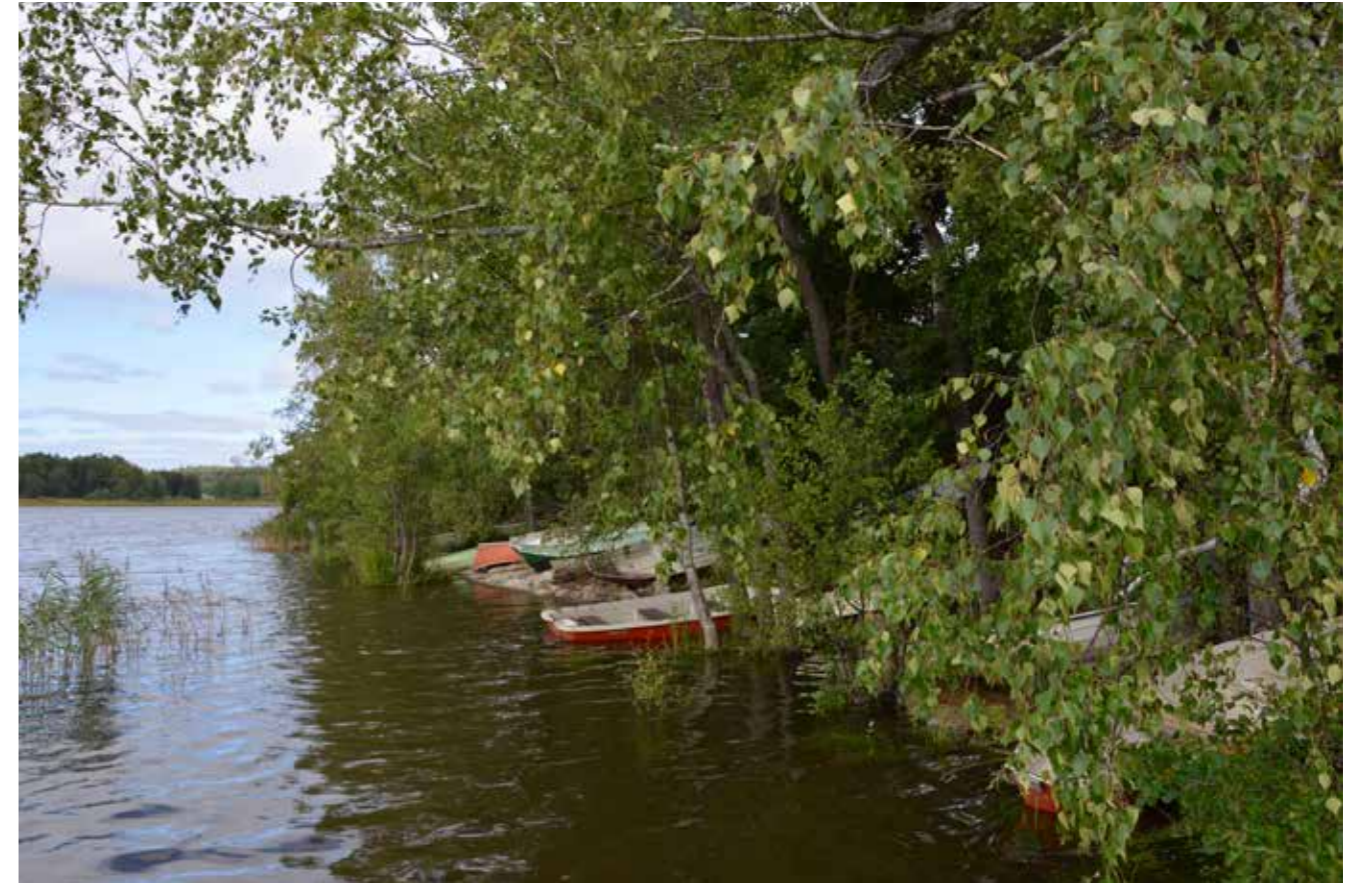
Veden pinnan korkeus vaihteli suuresti tänä kesänä.