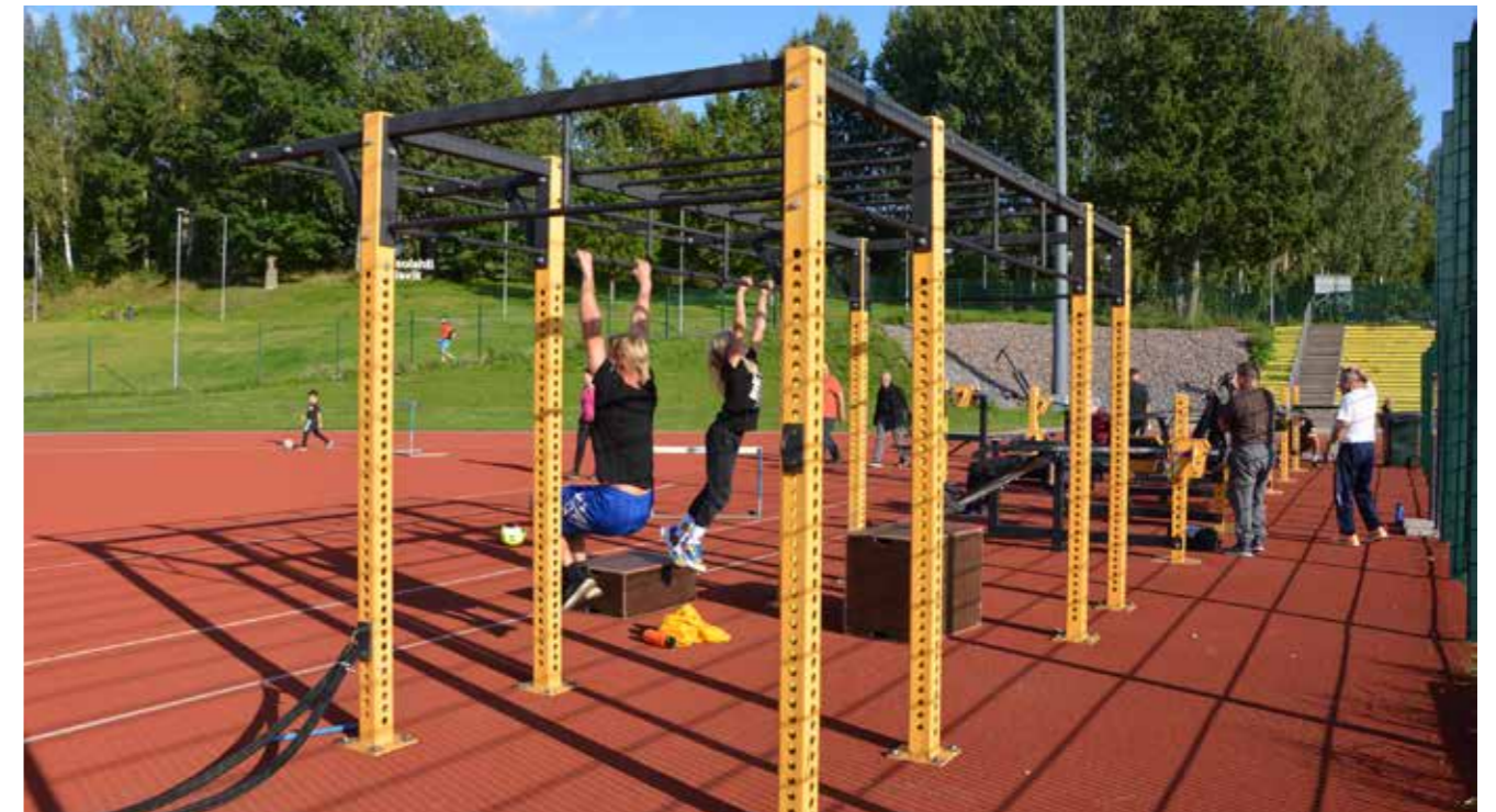
Kuntoilijoita Laaksolahden urheilukentän ulkokuntosalilla.