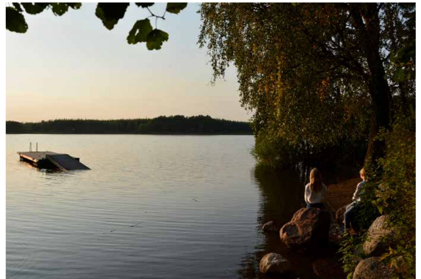
Elokuun lopussa hiekkaranta oli hävinnyt ja laituri kaukana.