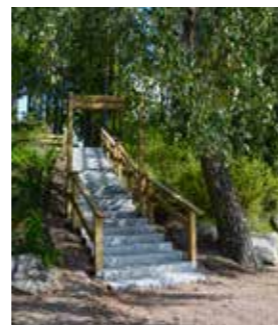
Kannen kuva: "Jupperinrannan portaat" Elina Airaksinen

Seuraava lehti 4/2021 ilmestyy 13.11.2021, aineistot 18.10. mennessä toimitus@jupperi.fi