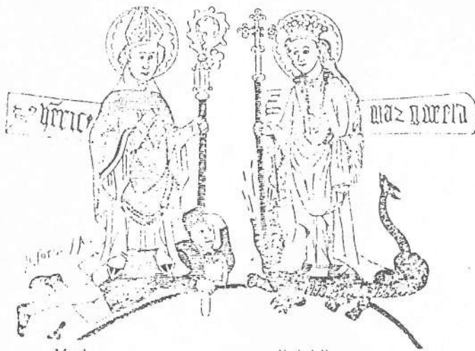
Marketta "tramppaa" matoa eli lohikäärmettä.

Rannalla olevan pakanan lipussa on selvä lohikäärmeen kuva. Lisäksi on Kaarinan kirkossa puinen lohikäärmeveistos, joka lienee tehty Suomessa eläneen pedon mukaisesti luonnolliseen mittakaavaan?