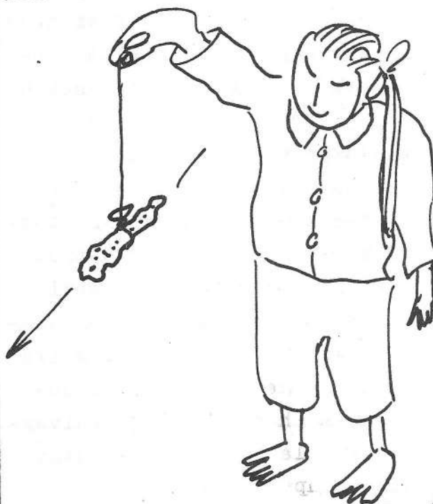
Eranto - Deklinaatio.

merenkulkijoiden käyttöön. Näistä ajoista kompassi ei ole muuttunut kovinkaan paljon. Toisin neula on nykyisin hienosti laakeroitu ja merikompassissa neulan tilalla on useampi sauvamagneetti sekä suuntaruusu. Nämä seikat tekevät kompassin helposti luettavaksi sekä tarkaksi.