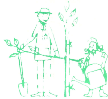
ISTUTA PUU NIIN OLET TEHNYT HYVAN TYÖN